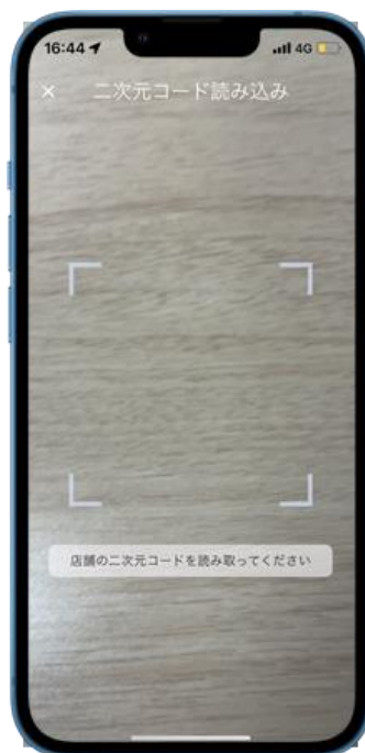
OFFICE PASSアプリやサイトで「チェックイン」ボタンを押下し、二次元コードを読み込む