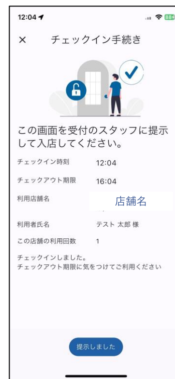
チェックイン完了画面を提示し入室手続きが完了