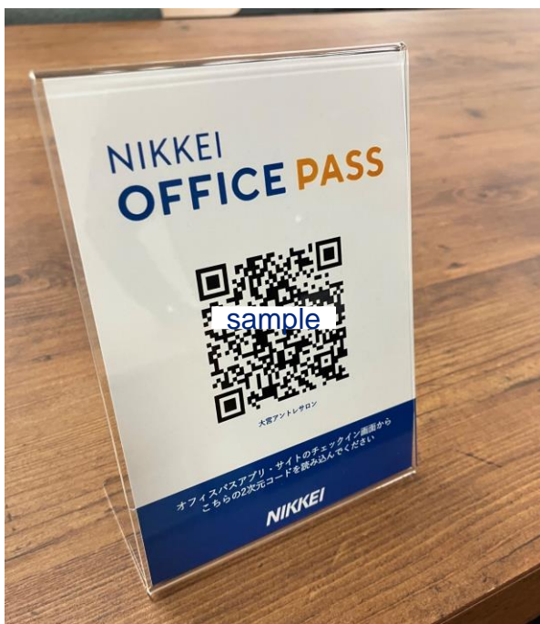
OFFICE PASS専用「二次元コード」